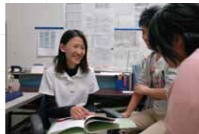
女性スタッフによる面談風景